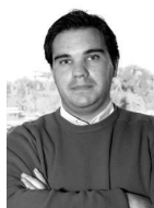
Fernando Pessoa, a propósito do "Livro do...